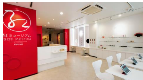
文政八年(1825)創業の紅屋・伊勢半本店が運営する「紅」と「化粧」の歴史や文化を紹介するミュージアム

WEBサイト https://isehanhonten-onlineshop.com