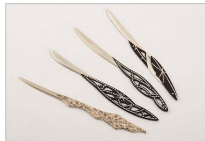
菓子切り 季の風ー春・夏・秋・冬ー