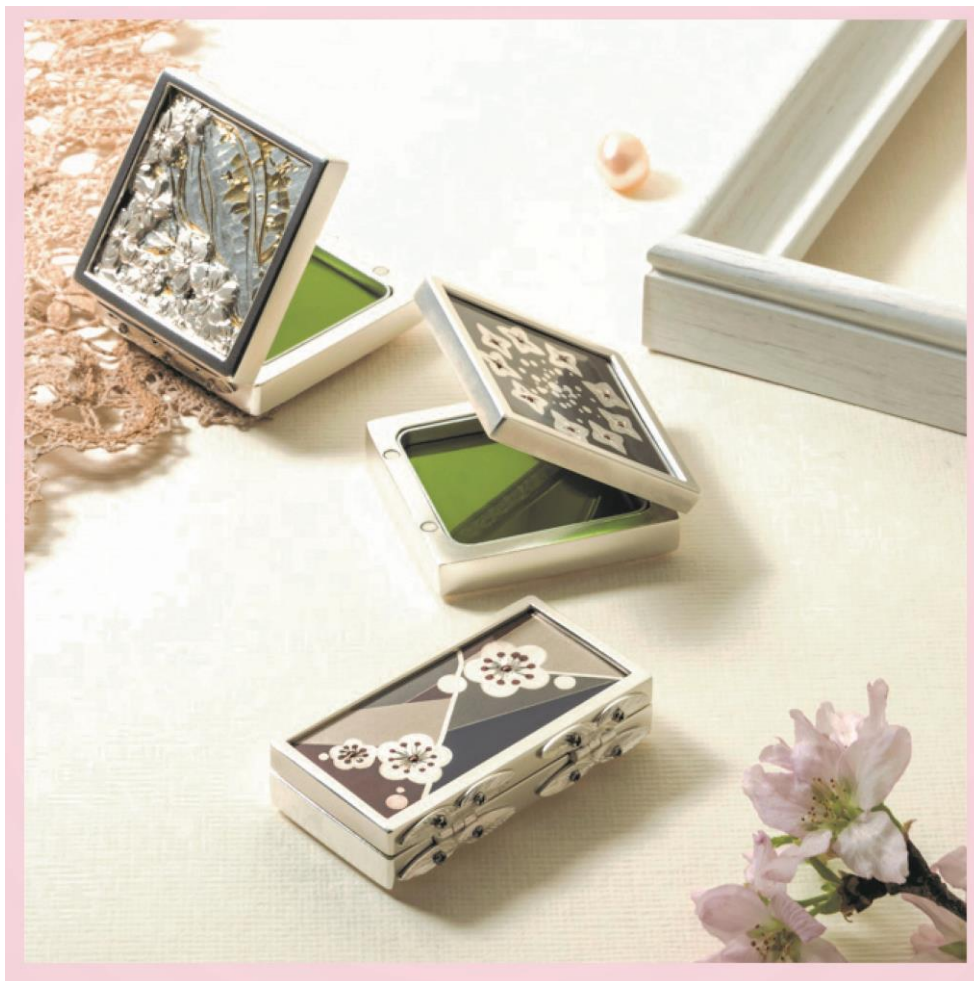
(小町紅の紅板作品)