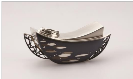
接合象嵌花器 水明

水面の輝きや星の瞬き、しずくがきらめく草花などの自然に触れた心象風景を、光沢のあるしなやかな金属素材を用いて表現しています。そっと彩りを添えてくれる優美な作品を暮らしの中に取り入れてみてはいかがでしょうか。