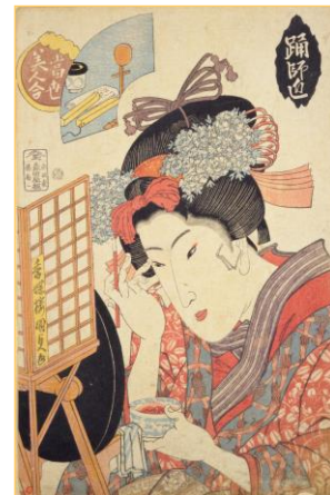
当世美人合躰師匠 歌川国貞画 国立国会図書館蔵