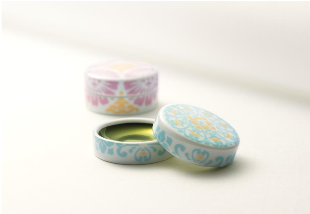
小町紅 凧(手前)、小町紅 華(奥)

凧とした神職のまとう絹衣のような爽やかな色合いの器に、日本伝統の化粧料・小町紅を刷いた逸品です。